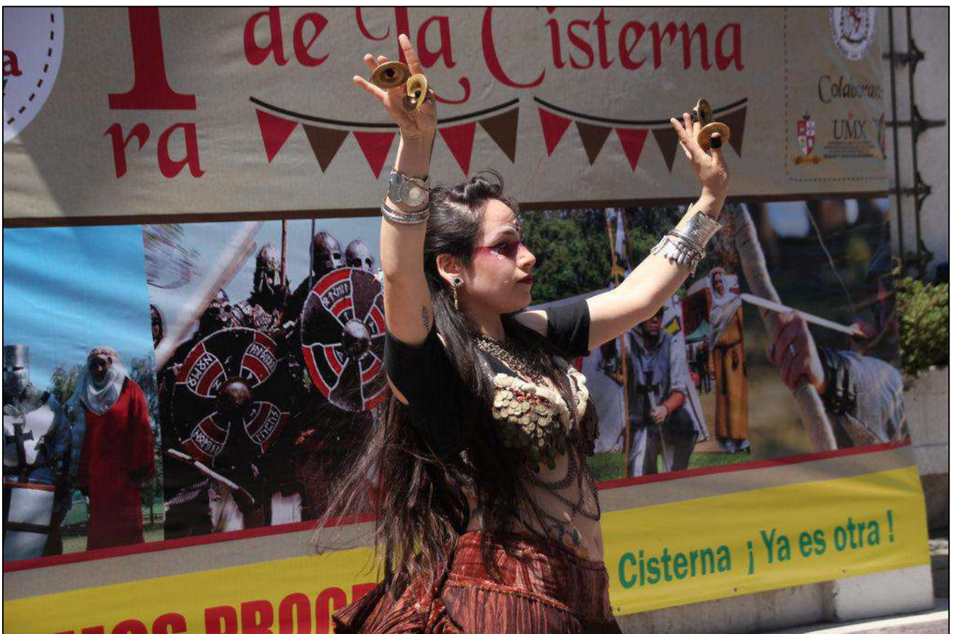
Danza Fusión de pueblos Orientales, Las Clandestinas