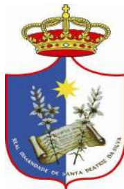
Real Irmandade de Santa Beatriz da Silva Portugal