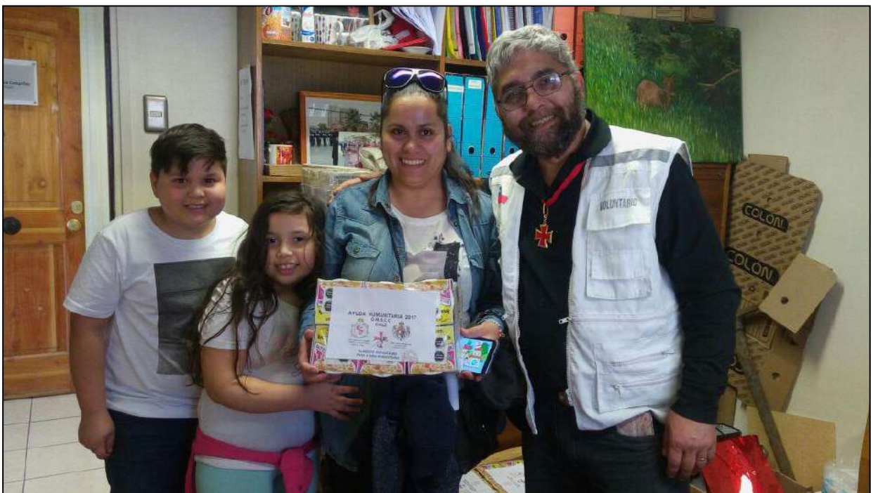
El año 2017 no sólo entregamos alimentos a personas en situación de calle, también implementamos la entrega a familias y personas de la tercera edad en situación vulnerable.