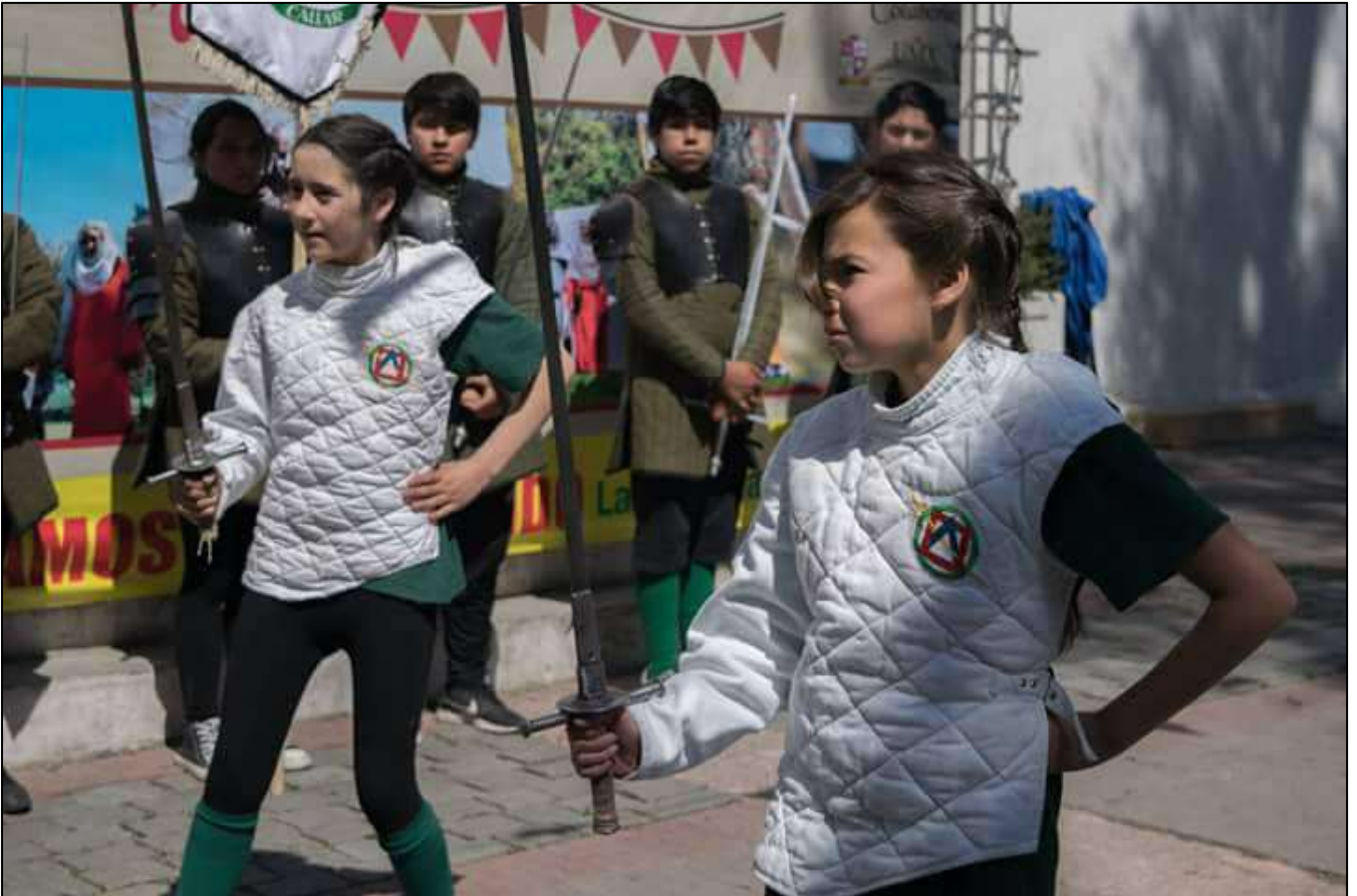
Demostración de la Escuela de Esgrima Histórica Bolognese