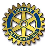
Rotary de la Cisterna