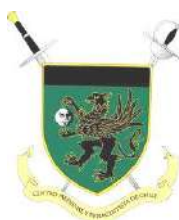
Centro Esgrima Medieval Histórica de Chile