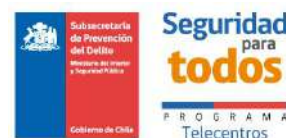
Telecentro de la Villa los Troncos La Cisterna