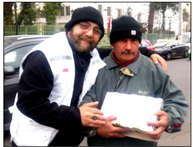
Nuestro Presidente Corporativo entregando alimentos a personas y familias vulnerables