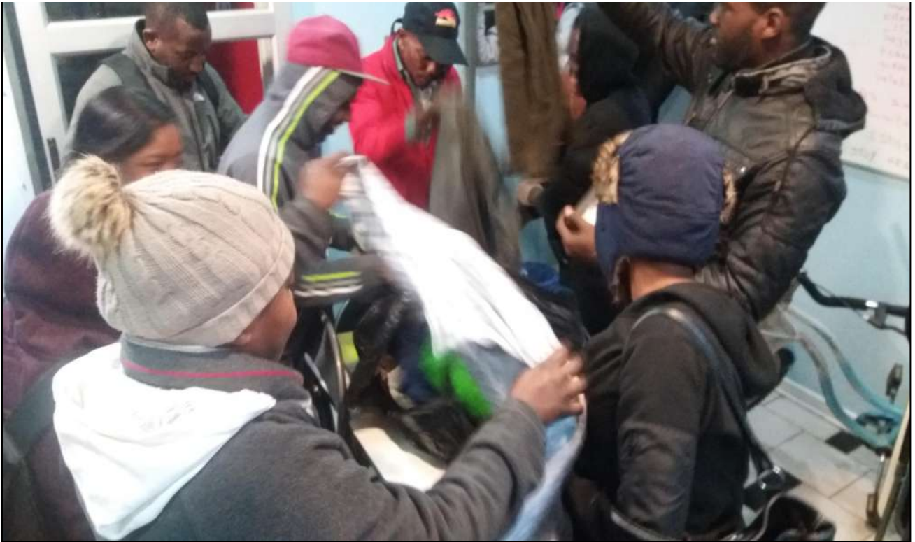
Entregando ropa de abrigo a migrantes haitianos en la comuna de la Cisterna y Pedro Aguirre Cerda