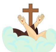
Iglesia Recoleta Franciscana Comedor Fray Andresito, de la Recoleta Franciscana