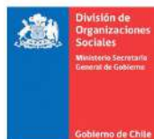
División de Organizaciones Sociales (DOS)