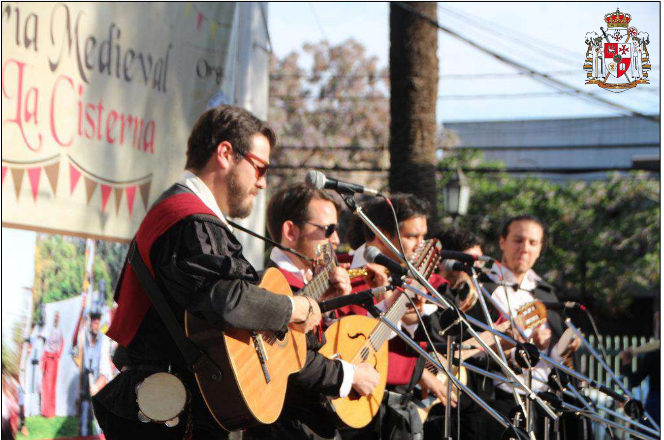
ESTUDIANTINA HIDALGOS ANDANTES DE SANTIAGO