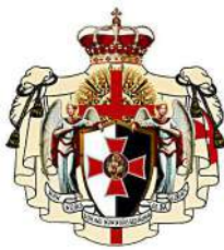
O.M.R.C.C. Ordine Militare e Religioso dei Cavalieri di Cristo Italia